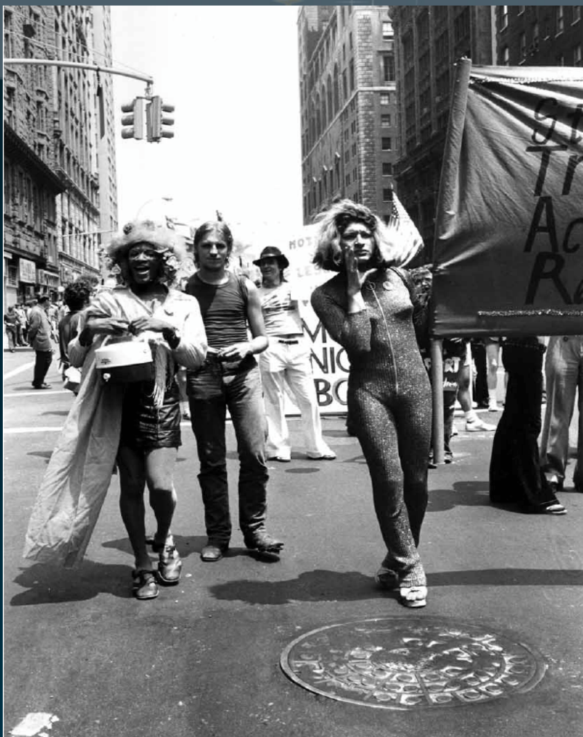
Sylvia Rivera (holding the banner) and Marsha P. Johnson (with cooler) of the Street Transvestite Action Revolutionaries (S.T.A.R.) at the Christopher Street Liberation Day, Gay Pride Parade, NYC (24 June 1973).